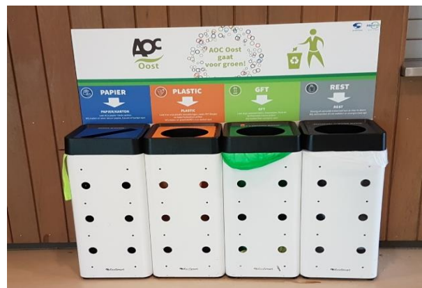
Voorbeeld van afvalbakken met duidelijke kleuren en symbolen (AOC Oost)