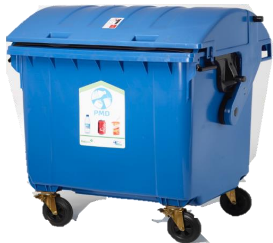
Voorbeeld van een PMD rolcontainer

Deze twee afvalstromen kunnen op dezelfde manier verwerkt worden. Veel scholen werken nu nog met grote zakken voor PMD en restafval die bewaard worden in opbergruimtes (vooral PMD) of buiten. Een rolcontainer zou een oplossing kunnen bieden voor het beter bewaren van het afval, voordat de zakken door de afvalinzamelaar opgehaald worden. Mocht je hier als school geen ruimte voor hebben, dan kan een ondergrondse container (van de gemeente) in de wijk een oplossing bieden. Hierover kunnen afspraken gemaakt worden met de gecontracteerde afvalinzamelaar.