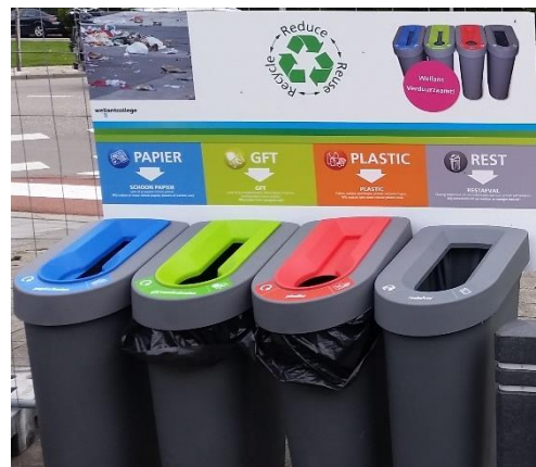
Bij deze prullenbakken is goed nagedacht over de kleuren van de bakken en de verschillende inwerpopeningen (Wellantcollege Aalsmeer)

Het is belangrijk dat er in het gehele pand eenzelfde soort bak staat met daarbij verschillen in kleur voor de verschillende afvalstromen. Het moet altijd direct duidelijk zijn welk afval er in de bak hoort. Daarom is het belangrijk dat de juiste kleuren en pictogrammen op de bakken staan. Daarnaast kan de vorm van de afvalbak ook een belangrijke bijdrage leveren, zoals een passende inwerp-opening voor de betreffende afvalstroom. Een opening voor papier is vaak smal en een opening voor glas rond.